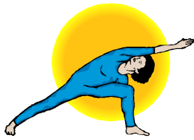
Bodyforming/Pilates/ Rückenfit/Fitness-Training Erwachsene