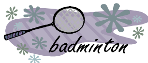
Badminton Freizeit Erwachsene