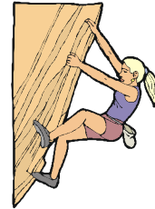
Abenteuer- und Erlebnissport ab 8 Jahre