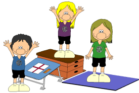
Kinderturnen von 3 – 6 Jahre