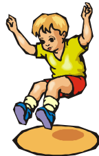
Kleinkindererlebnisturnen ½ – 4 Jahre